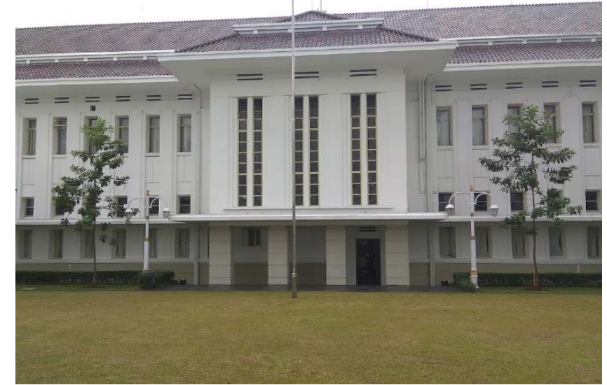
Jalan Medan Merdeka Selatan No. 18 Jakarta Pusat, Daerah Khusus Ibu Kota - Jakarta 10110